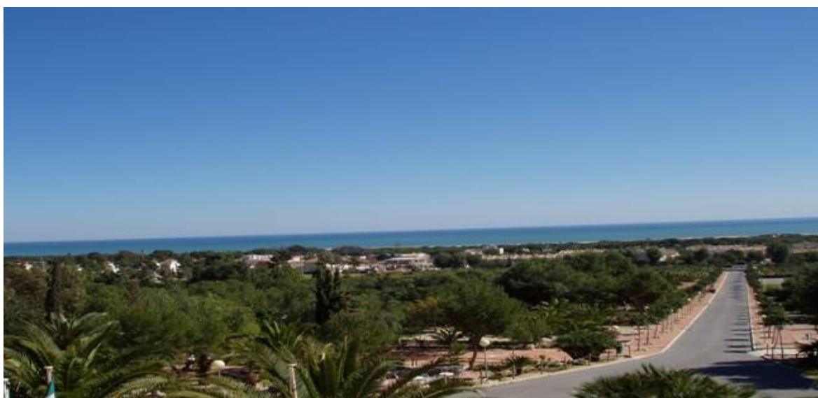
Vista del Mar Mediterráneo desde la Residencia Santa María del Mar .