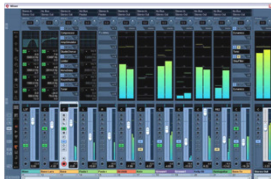
Figura 4 Captura de pantalla MIXER Cubase.