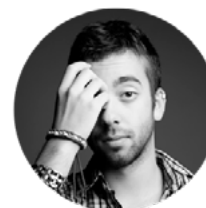
JAVIER PAJUELO ILUSTRACIÓN