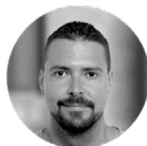
JAIME DE LA TORRE ILUSTRACIÓN