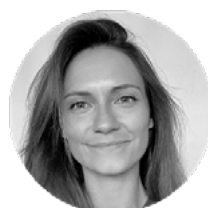
MARTA GARCÍA NAVARRO ILUSTRACIÓN