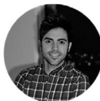
JUAN JESÚS MARTÍNEZ ILUSTRACIÓN