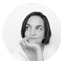
FÁTIMA ACASO ILUSTRACIÓN