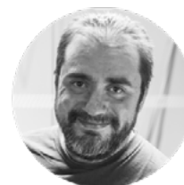
LUIS TOMÁS CONCEPT ART | ILUSTRACIÓN