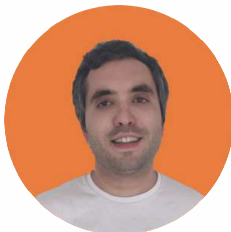
Aitor Pradas Web para Emprendedores