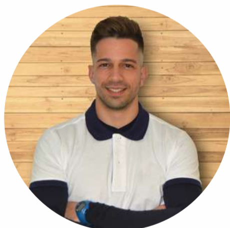
Julián Romero Publicidad Digital